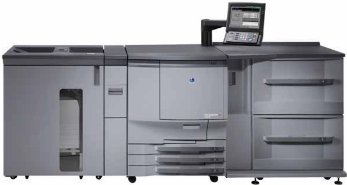
Bizhub PRO C65hc