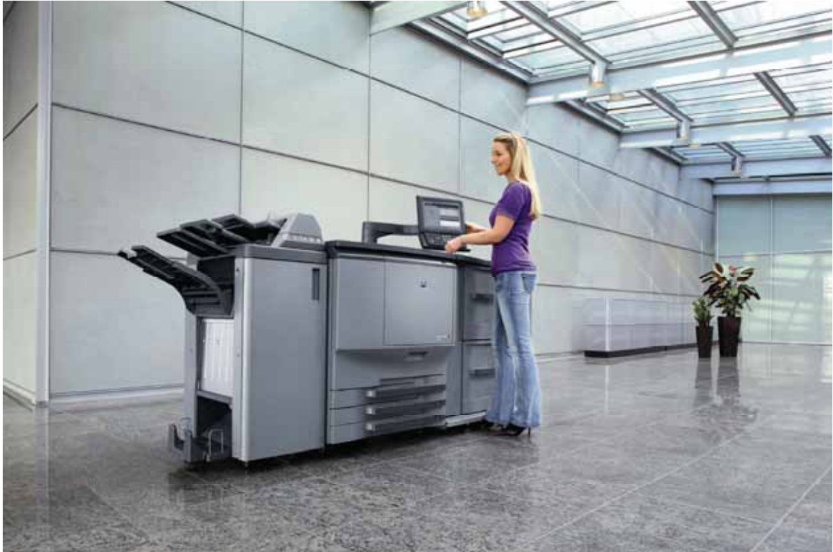
Bizhub PRO C65hc