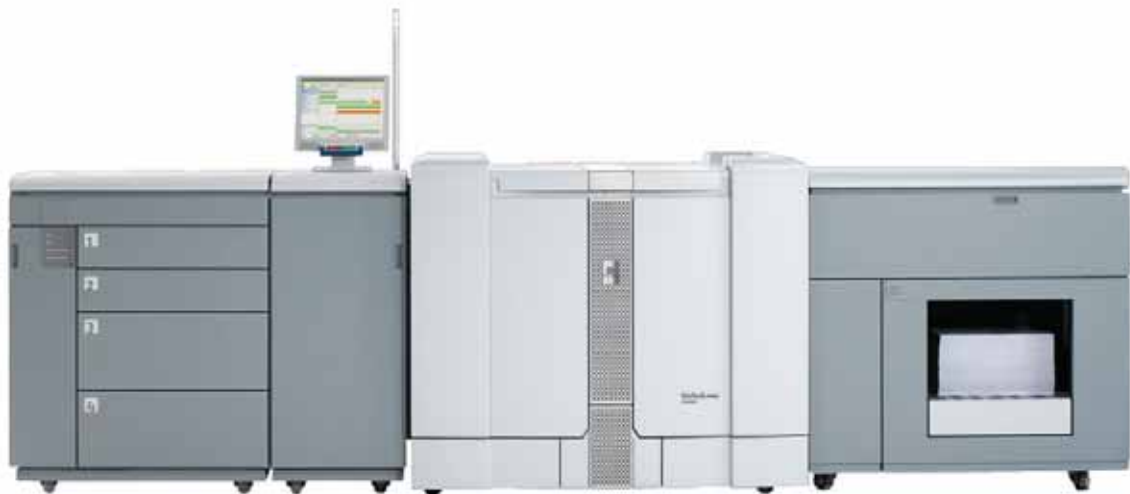
Bizhub PRO 2500P