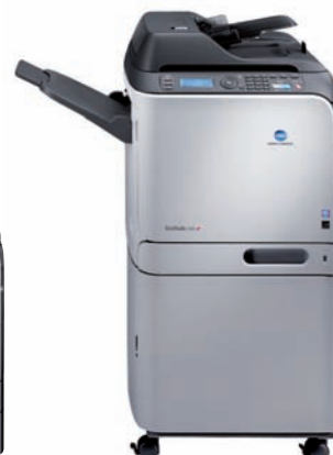
bizhub c20 mit Untertisch