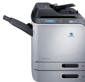
bizhub c20 mit Papierkassette