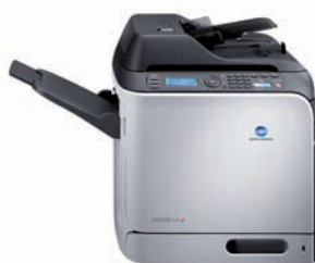
bizhub c20 Standardausführung